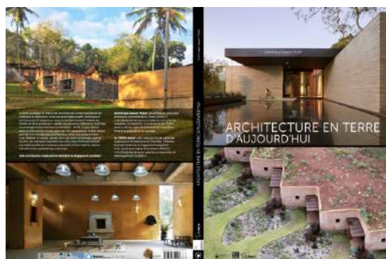
TERRA Award, „Lehmarchitektur Heute“; vdf Hochschulverlag an der ETH Zürich.