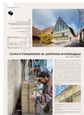
TERRA Award, Projekte.