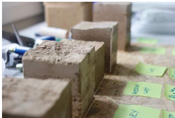
Grounded Materials.