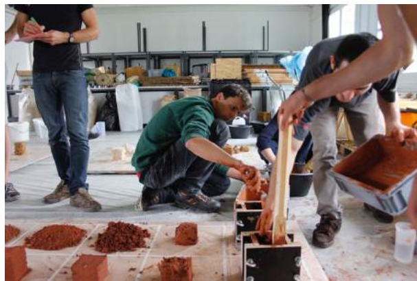
Grounded Materials.