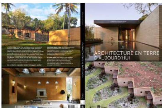
TERRA Award, „Lehmarchitektur Heute“; vdf Hochschulverlag an der ETH Zürich.