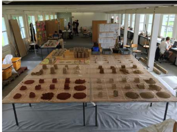
Grounded Materials.