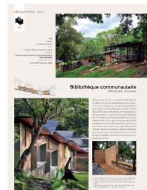
TERRA Award, Projekte.